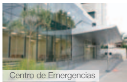
Centro de Emergencias